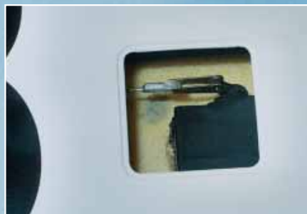
Undercover: das Servo zur Anlenkung der Störklappen