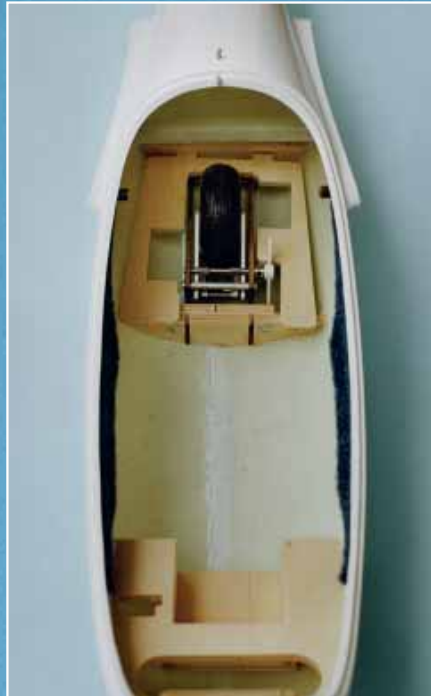
Kommt so ausgebaut beim Kunden an: Staufbiels Rumpf der »ASW 28-18«

Ach ja, zur Betätigung des Einziehfahrwerks genügt ein herkömmliches Standard-Servo, es ist keinesfalls nötig, hier ein Exemplar mit 170 Grad Weg zu verbauen.