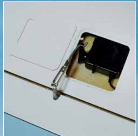
Futabas fantastisches S 3150 Digi mit 10,8 mm Dicke ist mit der Schale verklebt, daneben der bereits zugerichtete GfK-Deckel und der als Ruderhorn fungierende Augbolzen, er ist am Drucksteg des Ruders ordentlich verharzt