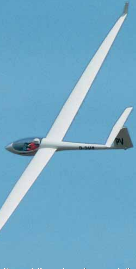
Aber auch Kurven kann sie ganz gut, die Thermik sollte aber schon etwas großflächiger sein