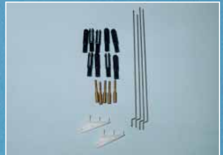
Gehört nicht an ein solches Modell: das Zubehör