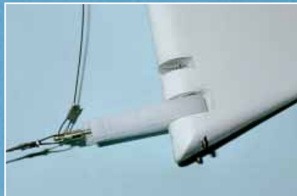
Schrulligkeit: Das ist die Seitenruderanlenkung, die zwar prinzipiell funktioniert, aber um die Nullstellung ein recht weiches Ruder ergibt