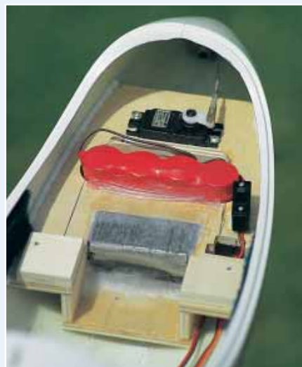
So sieht das Ganze aus, wenn das komplette elektrische und elektronische Equipment an seinem Platz ist